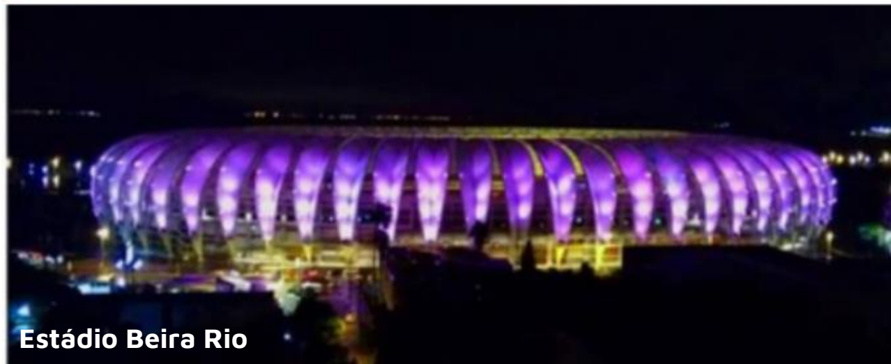
Estádio Beira Rio