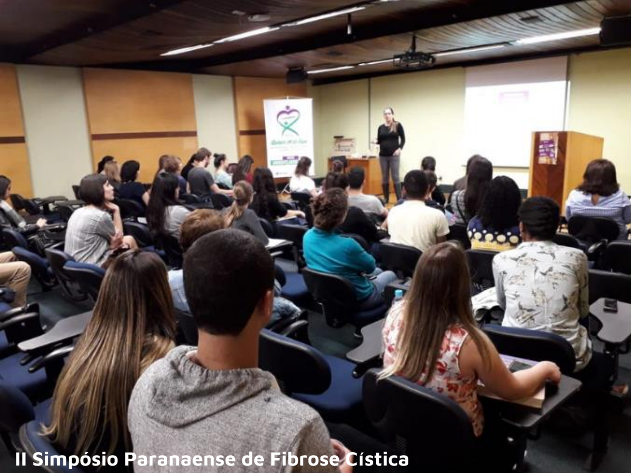
II Simpósio Paranaense de Fibrose Cística