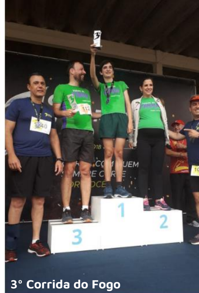
3º Corrida do Fogo