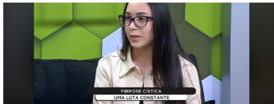
FIBROSE CÍSTICA UMA LUTA CONSTANTE

16/09/2018 às 08:18 - Atualizado em 15/09/2018 às 11:22 - por Carla Hachmann Colle