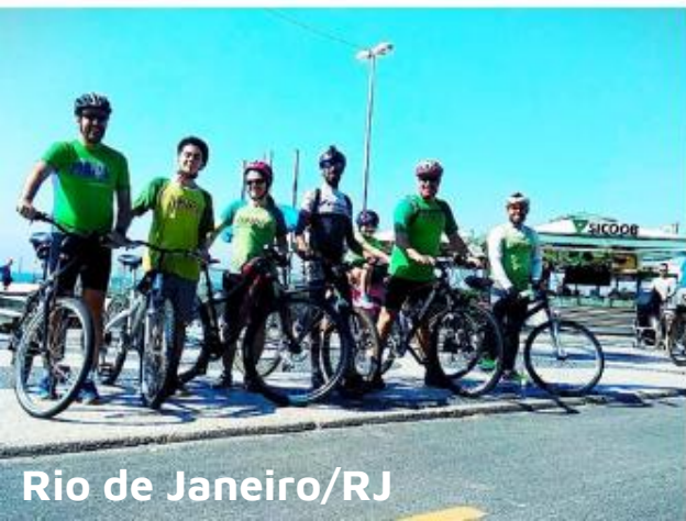
Rio de Janeiro/RJ