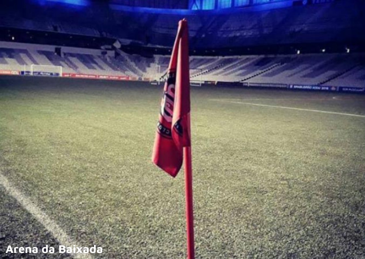
Arena da Baixada