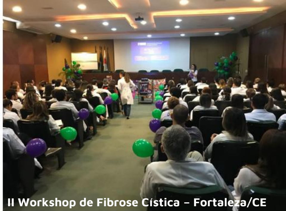
II Workshop de Fibrose Cística – Fortaleza/CE