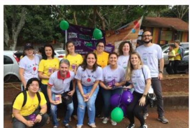
Foz do Iguaçu/PR