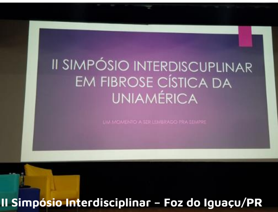
II Simpósio Interdisciplinar – Foz do Iguaçu/PR