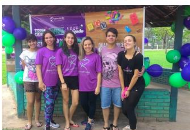
Santa Bárbara d'Oeste/SP