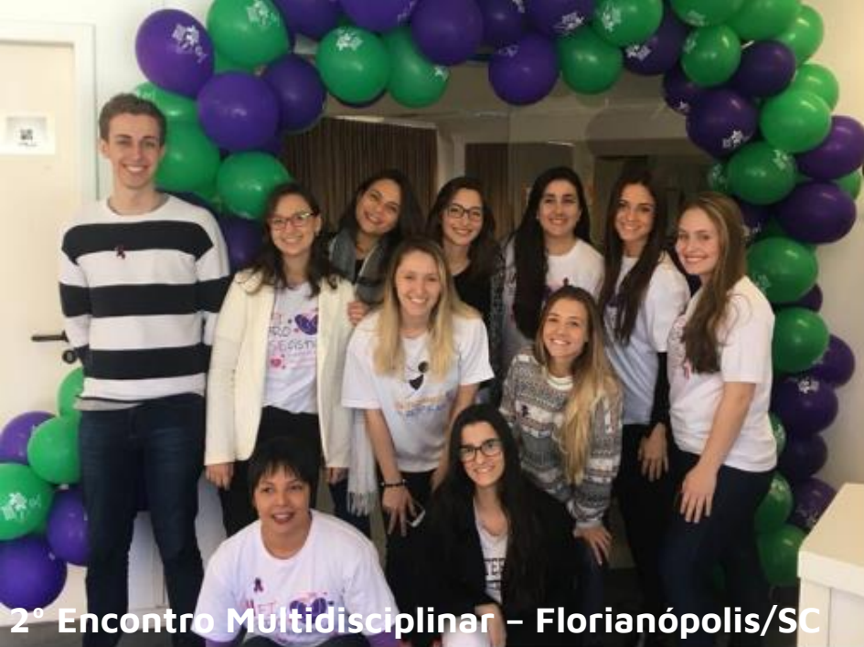
2º Encontro Multidisciplinar – Florianópolis/SC